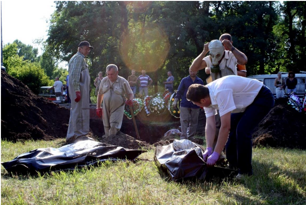
Масове поховання жертв терористів в Слов'янську, липень 2014, джерело: hrw.org

інтерв'ю кореспонденту російського пропагандистського каналу «Сегодня.ру» Юрію Котенку в березні 2020.