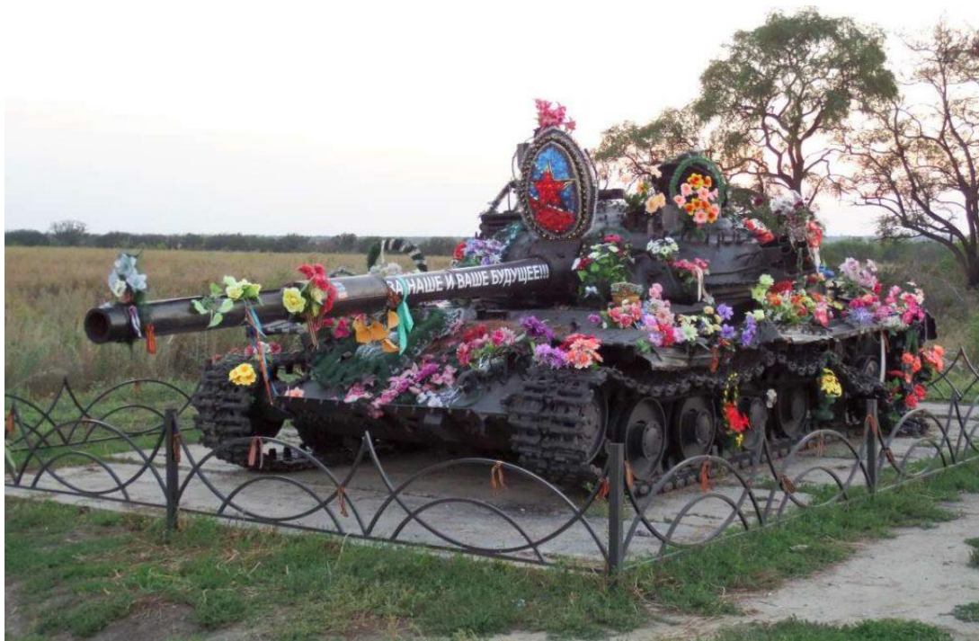
Пам'ятник «чорному танку» в с. Хрящувате Луганської обл.

Ця історія закріплює притаманні радянському суспільству ідеали «смекалочкі» (спроможності виконати завдання в умовах браку ресурсів), «всенародної єдності перед обличчям загрози», «вірності славним традиціям предків» (« діди воювали »), «суїцидального подвигу невідомого героя» як нормативи поведінки.